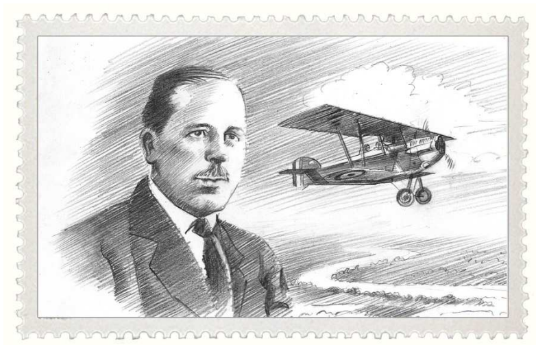
Maquette de timbre réalisée par Benjamin Freudenthal